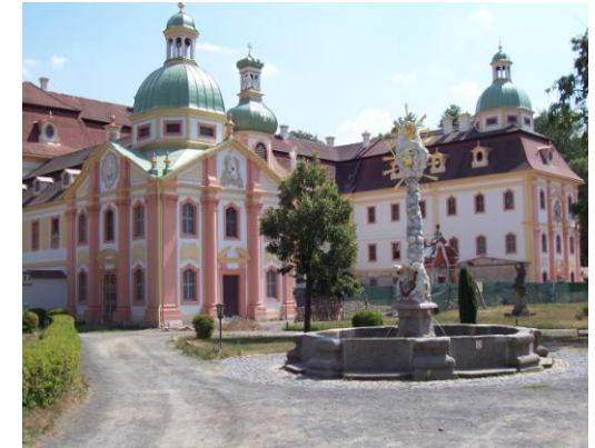
Kloster St. Marienthal